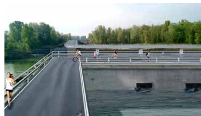
Diga o manufatto di sbarramento: a sinistra l'attuale aspetto della diga, a destra un render che mostra il ponte ciclo-pedonale che sarà costruito sopra al manufatto e permetterà l'attraversamento del fiume