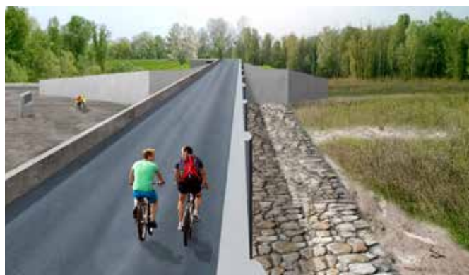
Manufatto sfioratore: a sinistra l'attuale aspetto, a destra un render che mostra la nuova pista ciclabile