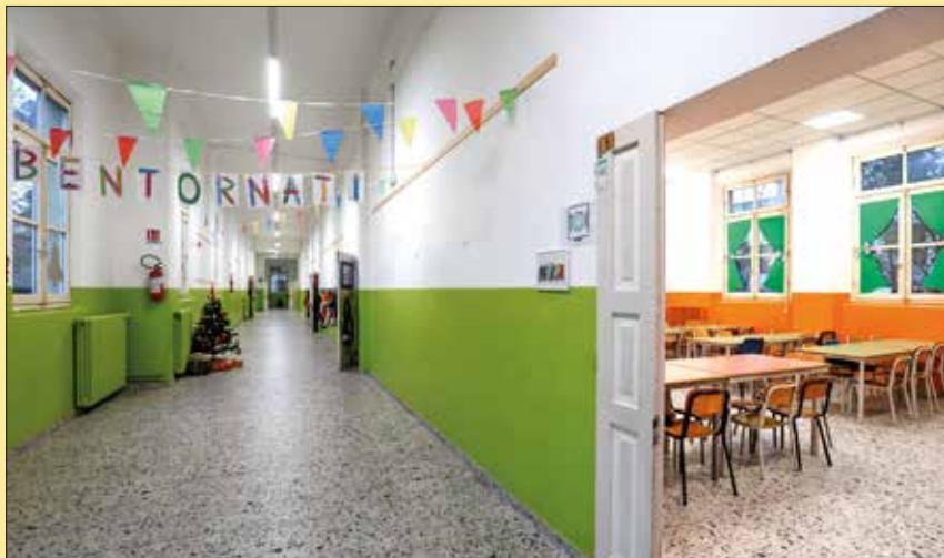
In foto, alcuni degli spazi rinnovati della scuola primaria De Amicis

mensa: due refettori da 48 posti ciascuno, dotati di uscite di sicurezza ed espandibili negli spazi polifunzionali. Si è posta particolare attenzione alle disabilità cui è dedicata la torretta nord, vista la presenza dell'ascensore e la vicinanza all'area parcheggi, con spazio inclusivo, aula 'morbida', spazio polivalente e servizi igienici. Con l'intervento, l'intera scuola è ora accessibile ai disabili. Al primo piano sono stati collocati laboratorio di Inglese e aula Stem, con un Teach Bus con tablet, la biblioteca e spogliatoio degli alunni, i servizi e una rampa con scale per il superamento del dislivello verso la palestra. Nell'ala nord, al primo piano, è stata realizzata la nuova palestra da 172 metri quadrati. Al primo piano trovano collocazione il laboratorio di arte e una piccola biblioteca insegnanti. Il laboratorio di musica a piano terra accoglie anche una mostra permanente dal titolo "La nostra Storia" che racconta l'evoluzione dell'edificio scolastico dal 1911 a oggi.