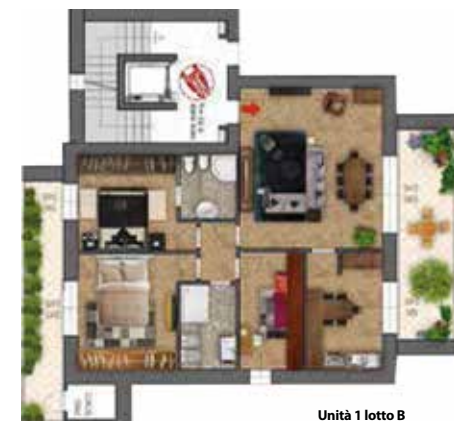
Unità 1 lotto B

appartamento con garage e posto auto sup. comm tot 152,90 mq