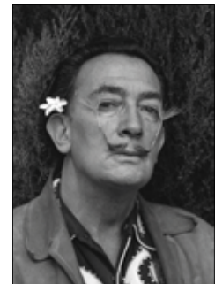
Salvador Dalí, ritratto con gelsomino

psiche, ha superato i 26 mila visitatori e nelle prossime settimane sarà arricchita dall'arrivo di una decina di nuove