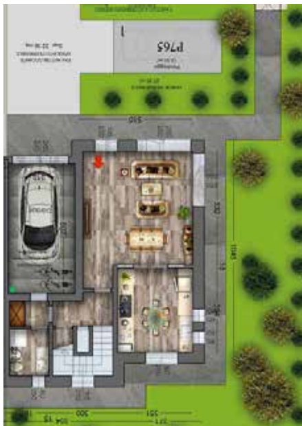
Villette piano terra e piano primo

appartamento su due livelli con soffitta, garage e posto auto sup. comm tot 227 mq area cortiliva circa 230 mq