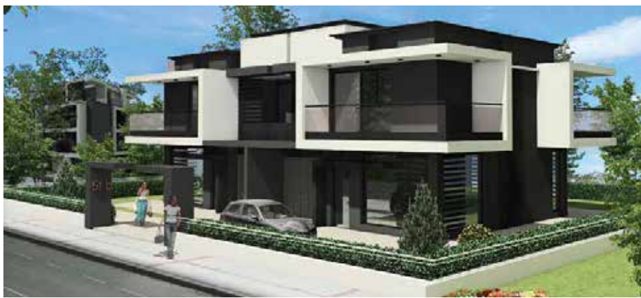
Villette abbinate lotti C e D