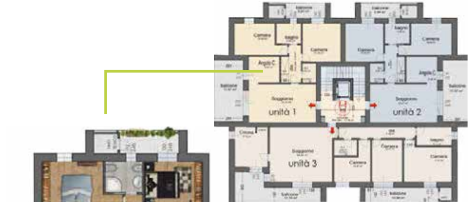
Palazzina 10 alloggi lotto A piano tipo 1,2 e 3