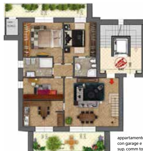
Unità 5 lotto B piano terzo e quarto doppio volume

appartamento su due livelli con garage e posto auto sup. comm tot 209,9 mq