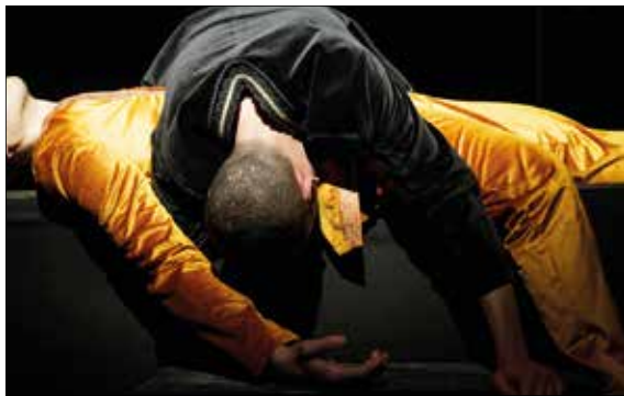
Alcune foto tratte da Antigone , Sette contro Tebe e il personaggio di Tiresia

due “maratone” in programma domenica 16 e domenica 23 febbraio.