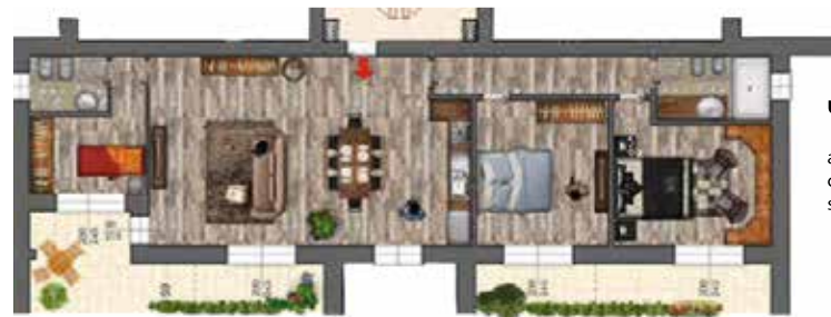
Unità 6 lotto A appartamento con garage e posto auto sup. comm tot 174,9 mq

Il portoncino di ingresso all'alloggio sarà del tipo blindato di classe 3. I pavimenti degli alloggi saranno in gres porcellanato di grandi dimensioni nelle zone giorno e servizi igienici ed in legno prefinito a 2 strati essenza a scelta tra Rovere o Iroko nelle stanze da letto.