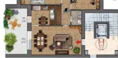
Unità 1 lotto A appartamento con garage e posto auto sup. comm tot. 127,90mq

L'impianto elettrico sarà del tipo sottotraccia in tutte le abitazioni, rispondente alla norma CEI 64-8. Le apparecchiature saranno della B-Ticino serie LIVING NOW con funzioni smart, connesse alla rete wi-fi di casa tramite specifico gateway. Questa linea rende gli alloggi interamente in DOMOTICA SMART avendo il controllo su: - Luci e avvolgibili (scenari) - Forza motrice e servizi; - Visualizzazione del consumo energetico, gestione carichi energetici con ricevimento di notifiche in caso di superamento di potenza o malfunzionamenti vari; - Termoregolazione; - Videocitofono e Controllo Locale; - Sistema antifurto con messaggistica allarme agli smartphone via SMS. Tutte le funzioni suddette saranno gestibili attraverso la tastiera "soft touch" o lo smartphone.