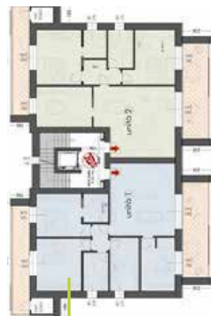
Palazzina 6 alloggi lotto B piano tipo 1 e 2

appartamento con garage e posto auto sup. comm tot 152,90 mq