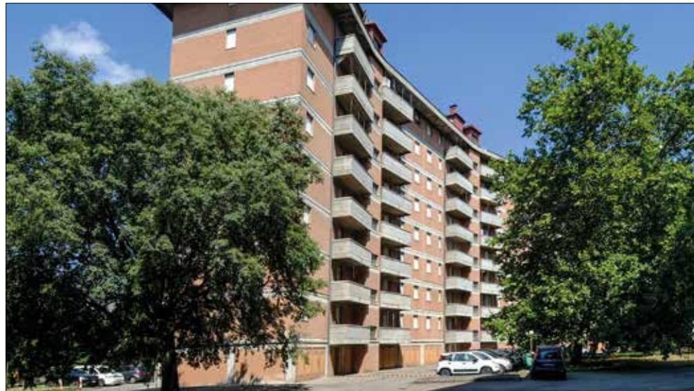
In foto, l'edificio di via Repubblica di Montefiorino i cui alloggi sono confluiti nel programma regionale "Patto per la casa"

Il Patto per la casa ha l'obiettivo prioritario di sostegno nella ricerca di soluzioni relative alla casa, in particolare per l'accesso alla locazione a canone agevolato dei nuclei in condizione di fragilità che hanno difficoltà ad accedere al mercato privato. Il Comune di Modena aderisce al programma gestendolo all'interno del servizio esistente di Agenzia casa con la modalità gestionale in house, in cui cioè l'Amministrazione si pone come intermediario tra domanda e offerta in-